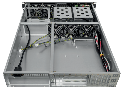
POSTERIOR | ABIERTA